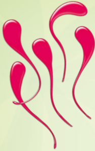
8 sticky tongues (including 2 spare tongues)