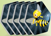
5 Wasp tokens