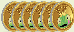
30 Yummy tokens