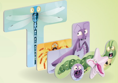
30 Krabbeltierplättchen (6 x 5 verschiedene Farben)